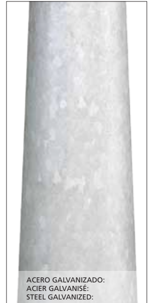
ACERO GALVANIZADO: ACIER GALVANISÉ: STEEL GALVANIZED:

Troncoconica pole designed in one single piece. Pole made of S-235-JR hot dip galvanized steel. Optional: Product available in colours, to consult.